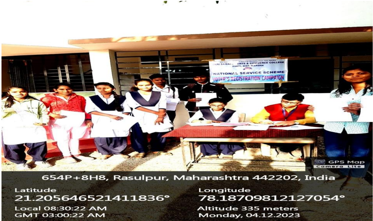
PHOTO GALLERY OF ELECTORAL LITERACY CLUB